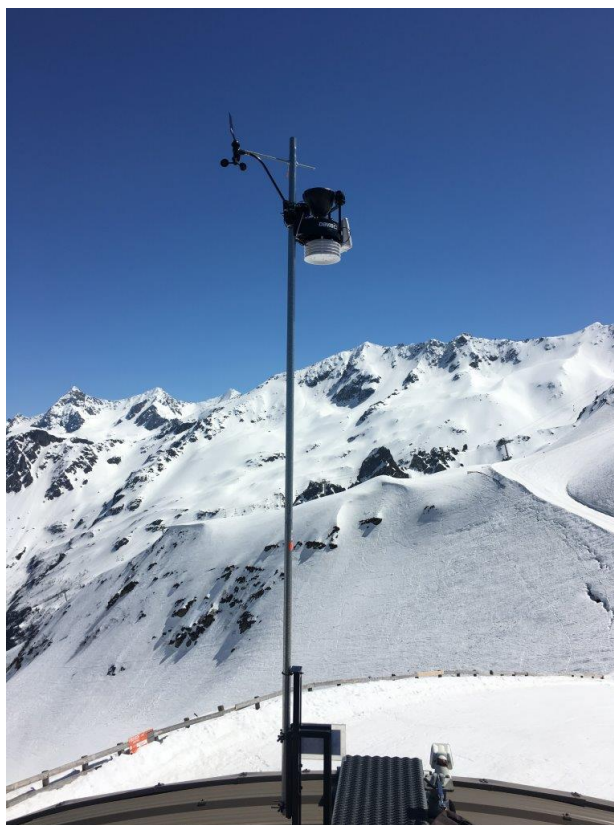
Vue vers le Sud-Est