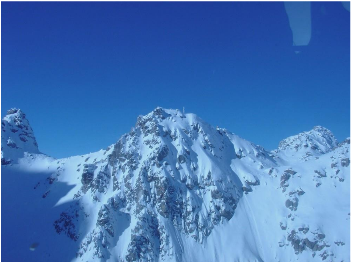
Sommet avec la station