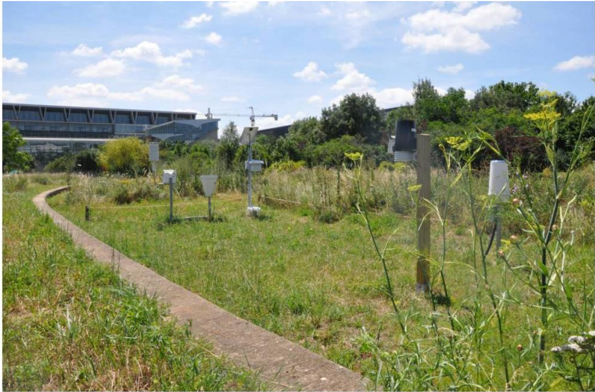
Vue vers le Sud