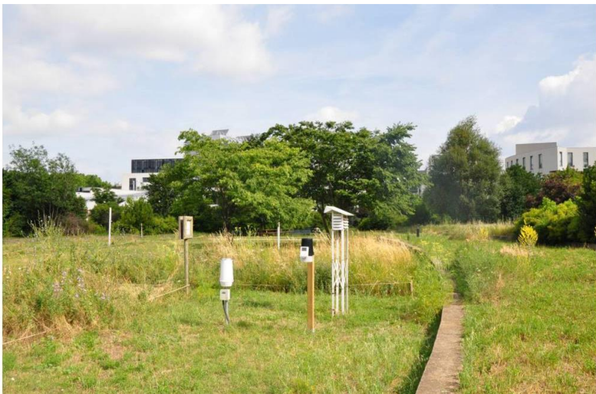
Vers le nord