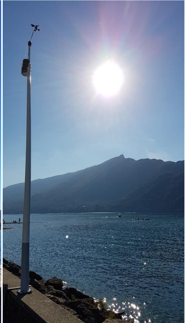
Vue vers le Sud-Sud-Ouest